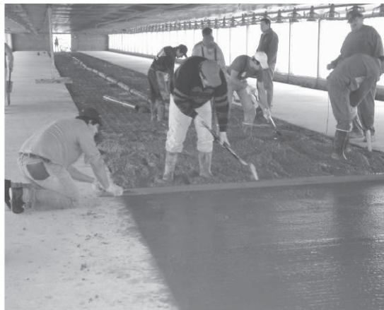
De izquierda a derecha: Construcción de vereda, Construcción piso y Nido automático