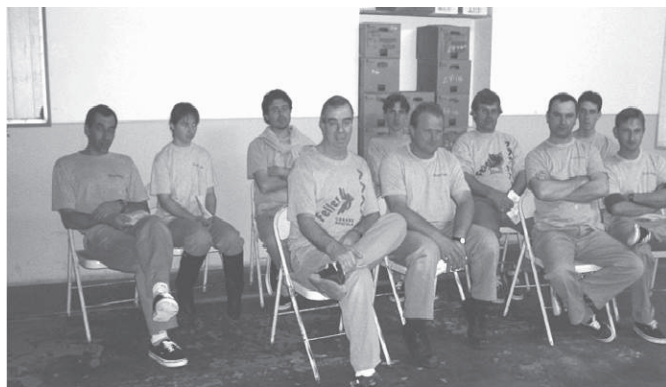
Personal de Planta de Incubación durante Capacitación sobre Seguridad Industrial

Entrega al personal de las plantas de incubación de Elementos de Protección Personal. Implementación de Procedimiento de investigación por parte de los encargados de planta, de accidentes y control de ausentismos. Se analizo la modificación de los procedimientos de trabajo( documentos) en diferentes sectores de planta en lo referente a los elementos de protección personal, manteniendo el formato de documento existente. A partir del análisis ergonómico de los choferes de camiones de Feller se sugirió el cambio de trabajo para carga y descarga de cajones de huevo. Confección de planillas e investigación de Accidentes ocurridos en Planta